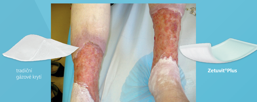
tradiční gázové krytí

Kontrola a převaz rány probíhal každý den večer a byl proveden pracovníky agentury domácí péče.